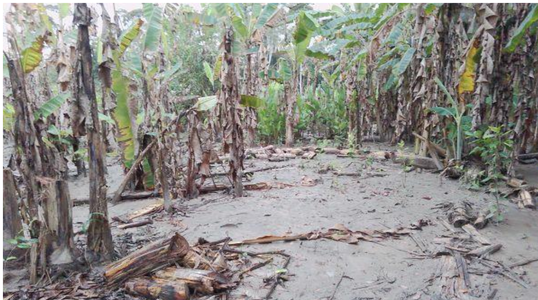
FIGURA N°03: ÁREAS DE CULTIVO AFECTADAS POR LAS INUNDACIONES