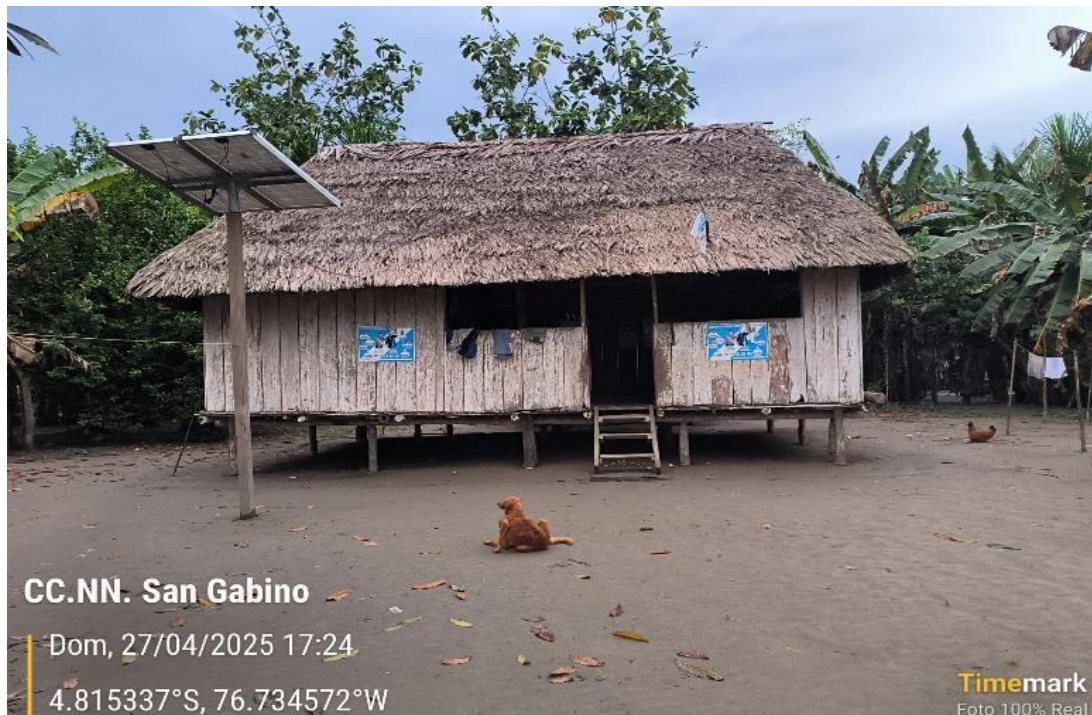
FIGURA N°01: VIVIENDAS AFECTADAS POR LAS INUNDACIONES