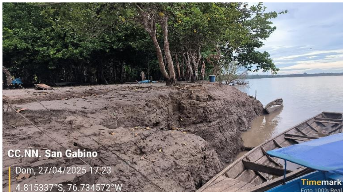
FIGURA N°02: RIBERAS EXPUESTAS A LA EROSIÓN FLUVIAL